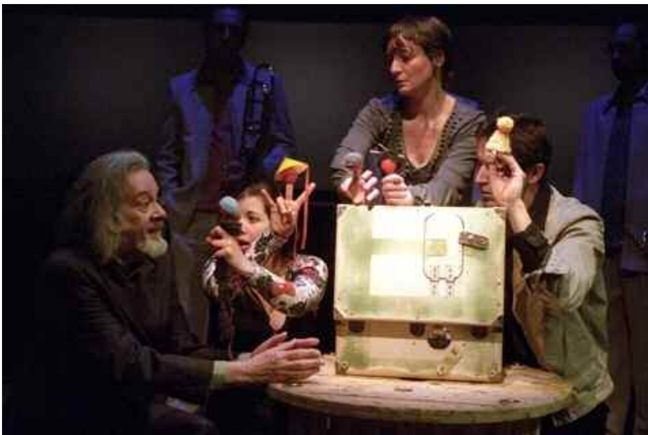
© Jean-Pierre Estournet - "Le kolobok enchanté" - Mars 2009.

Voilà comment est né le projet « Petit peuple mange » ( dont le titre est provisoire à ce jour ).