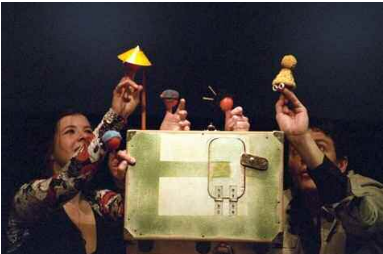
© Jean-Pierre Estournet - "Le kolobok enchanté" - Mars 2009.